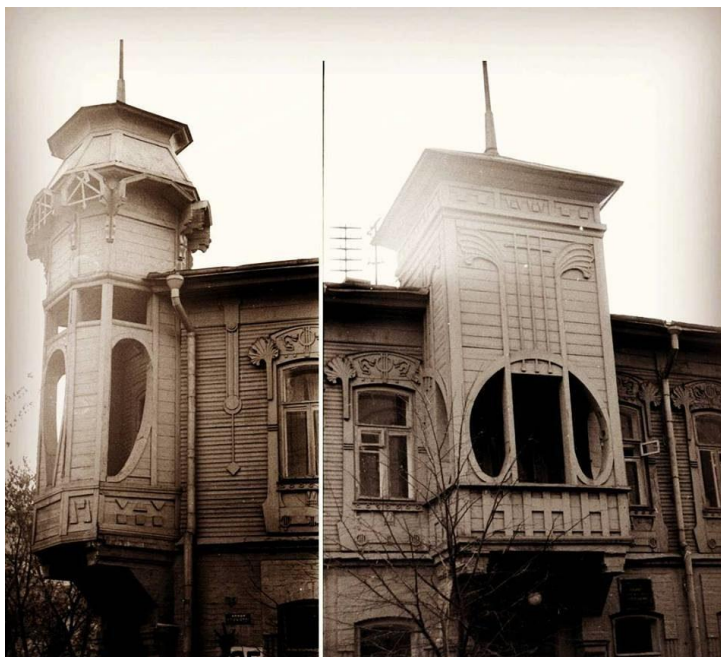
Ил. 5. Фрагменты утраченного здания в стиле модерн, ул. Коммуны (Скобелевской), 85. П. 5. Fragments of the building in Art Nouveau style, st. The Commune (Skobelevskaya), 85 https://www.ok.ru/nashchelyabinsk/topic/68214906497838

Кроме того, во дворе непосредственно за территорией строительства по ныне расположено здание конторы Валеева, также декорированное характерными растительными мотивами. Становится очевидным, что автор, оценивая важность преемственного подхода к проектированию в исторической среде, останавливает свой выбор на эпохальном стиле модерн, транслируя его в современном прочтении. Автор признается: «Я занимался проектом реконструкции здания «Гостиный двор». Было очень сложно. В современной архитектуре можно только играть со стилями, и при реконструкции важно попасть в аналогию или контраст, в масштаб и материал и т. д. И здесь речь может идти только о культуре и такте проектировщика. И в первую очередь речь должна идти не о доходе, который можно получить от реконструкции здания, хотя об этом тоже забывать не стоит, а о том, что реконструируемое здание простояло века и простоит еще столько же. Не разорвется цепочка от прошлого к будущему» [6].