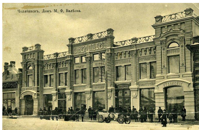
Ил. 1. Торговый дом М. Ф. Валеева на открытке старого Челябинска. Il. 1. M F Valeev's trading house on the postcard of the old Chelyabinsk https://vadi.sk/a/SNaBgeqJ3VnB9h/5af71fa9ee678e4886d86c06

Конструктивное же решение здания действительно являлось новым и прогрессивным на момент строительства. Оба этажа перекрыты железобетонными «сводами Монье», опирающиеся на балки, которые поддерживают равномерно расставленные квадратные в сечении кирпичные пилоны и круглые чугунные столбы [9], то есть было сформировано пространство, свободное для размещения торгового оборудования, легко трансформируемое для других сценариев использования. По некоторым свидетельствам над лестницей, ведущей в подвал, было устроено прозрачное перекрытие из стеклянных блоков (утрачено к настоящему времени). Это здание, несомненно, производило невероятное впечатление на жителей и гостей города и даже являлось одним из символов города – его фотографии печатались на открытках о городе (ил. 1).