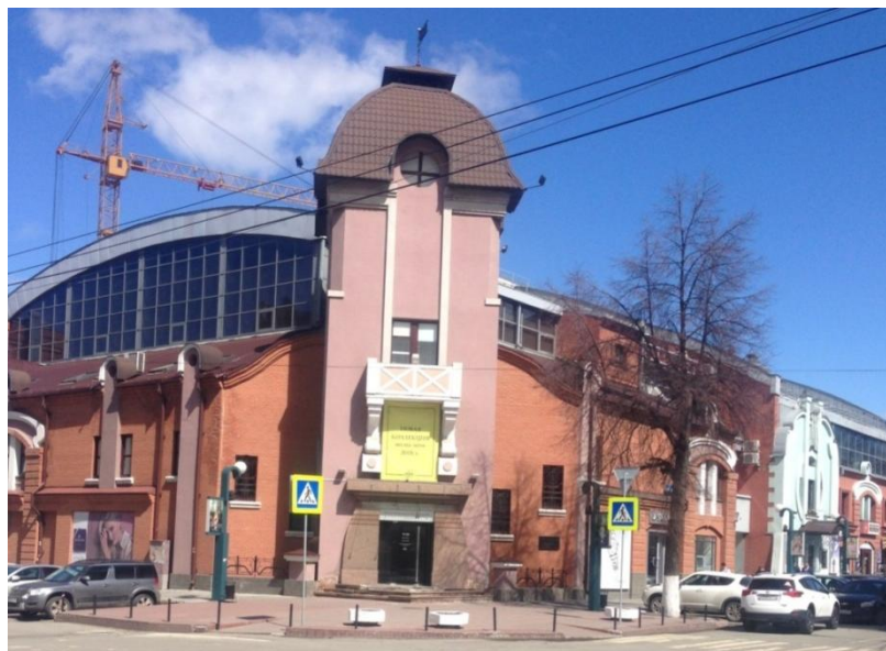
Ил. 6. Главный вход в здание торгового комплекса Гостинный двор. Пересечение улиц Коммуны и Елькина.

Il. 6. The main entrance to the Gostiny Dvor shopping center.