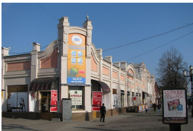
Ил. 2. Магазин купца Авдеева, ул. Кирова, 104-2, г. Челябинск. Il. 2. Shop merchant Avdeev, st. Kirov, 104-2, Chelyabinsk.

Вплотную к торговому дому Валеева, слева от него, пристроено здание магазина купца Авдеева [10], есть также мнение, что магазин принадлежал Антониде Грибушиной [5]. Оштукатуренное кирпичное здание с огромными витринами, хоть и не столь нарядное как торговый дом Валеева, однако по объемно-планировочному решению и архитектурным деталям фасада выдержано в более «чистом» модерне. Здание имеет ассиметричные уличные фасады, и амплитудный фронтон углового портала (ил.2).