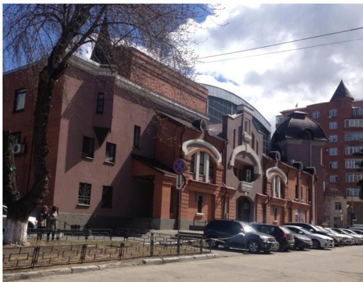
Ил. 7. Фасад здания торгового комплекса Гостиный двор со стороны ул. Елькина.

Il. 7. The facade of the shopping center Gostiny Dvor.