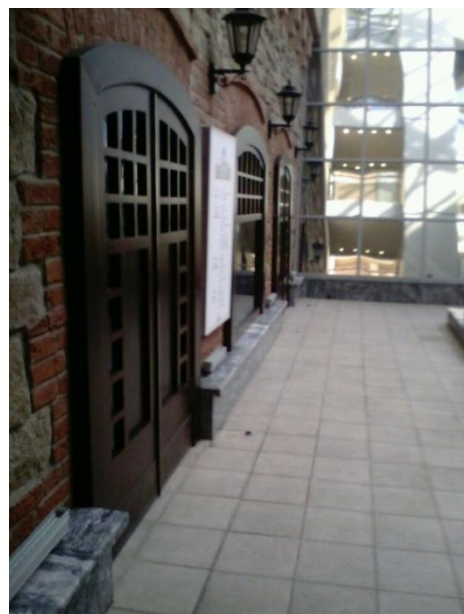
Ил. 3, 4. Фрагменты интерьера Торгового комплекса Гостиный двор. Каменная стена складов пивовара Вакана. 2017.

Il. 3, 4. Fragments of the interior of the Gostiny Dvor shopping center. 2017.