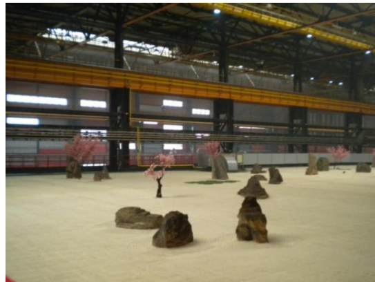
Ил.3–4. «Сад камней» в рекреационной зоне интерьера Челябинского трубопрокатного завода «Высота 239», 2010 г.

Во многих европейских странах промышленный туризм развит на высоком уровне: экскурсионные туры на сыродельные, пивоваренные, винодельные заводы осуществляются каждый день, и попасть на них может каждый желающий. Каждый тур продуман и отработан до мелочей – начиная от удобного трансфера, и заканчивая дегустацией в приятной атмосфере, где можно насладиться вкусом продукции и обсудить полученные знания, поделиться опытом и спланировать следующий промтур. Важно отметить, что промышленный туризм приобщает посетителей к индустриальному наследию, способствует патриотическому воспитанию, позволяет понять ценность данных объектов в региональных или мировых масштабах.