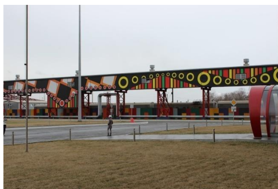
Ил.1–2. Челябинский трубопрокатный завод «Высота 239». Реконструкция С. Илышева и В. Юданова, 2010.

Это первый проект отечественной «белой металлургии», качественно нового типа, основанного на инновациях, высочайшем уровне технологий. В названии 239 метров – высота географической точки, где находится новый цех, соответствующая высоте южной части Уральского хребта над уровнем моря. Цех производит трубы большого диаметра для нефте- и газопроводов. Предприятие вызывает устойчивый интерес не только у сообщества узких специалистов инженеров, архитекторов и дизайнеров, но и у массового посетителя.