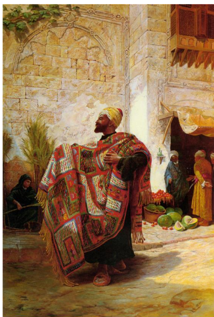
Ил.2. Неизвестный художник, XIX в.

отличается в художественном оформлении от классической Гарабахской, однако основные орнаменты, то есть медальоны, элементы бордюра, а также цветовая палитра остаются неизменными. Это дает основание предположить, что азербайджанские ковры, вывозимые за рубеж, в дальнейшем, много раз копировались, переходя из рук в руки, однако неизменными при этом оставались цветовое решение и основные элементы коврового орнамента. Разницу между копиями и оригиналом выдает несоответствие масштабов композиции орнаментов, а также, недостаточная заполненность центрального поля ковра, что несвойственно местной традиционной технике ковроткачества. Порой в полотнах зарубежных авторов использовались широко распространенные в Азербайджане ковровые композиции, орнаменты и даже образцы, воплощающие в себе генетическое наследие нашего народа (например, безворсовый ковер «Варни» ) (ил.2).