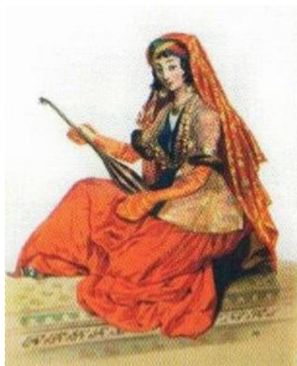
Ил.3. Г.Г. Гагарин. Шемахинская женщина. Кавказские типажи. Париж, 1840.

Русские живописцы также обращались к тематике азербайджанских ковров. Живший на Кавказе известный русский художник князь Г. Г. Гагарин (1810–1893) воплотил в своих работах богатый быт и творчество азербайджанского народа. В картине «Шемахинская женщина» художник воплотил образ женщины с музыкальным инструментом в руках, правильно изобразив формы построек и блистательно выдвинув на передний план картины, устланный ковром пол (ил. 3).