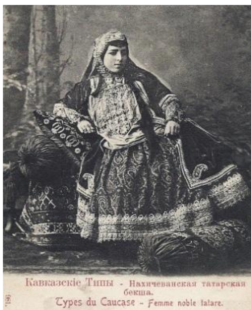
Ил. 9. Кавказские типы, фотография, конец XIX в.

Ковровая тематика во второй половине XIX века также занимала широкое место в фотоматериалах. На открытке « Кавказские типы. Женщина бекского рода из нахичеванских татар » [азербайджанцев] (ил. 9), запечатлена сидящая на ковре женщина, в национальной одежде, надевшей старинные, дорогие ювелирные украшения и прекрасную национальную одежду облокотившейся на подушку. В данной фото-композиции ковер и образцы художественной вышивки не просто фон, они представлены как произведения искусства. Судя по отношению к этим изделиям, ковер не просто настил, а модный, искусный аксессуар, украшающий комнату. Эта постановка, выполненная в форме модерн для своего времени и достаточно прогрессивная, ныне выглядит архаично, но представляет важную историческую и этнографическую ценность.