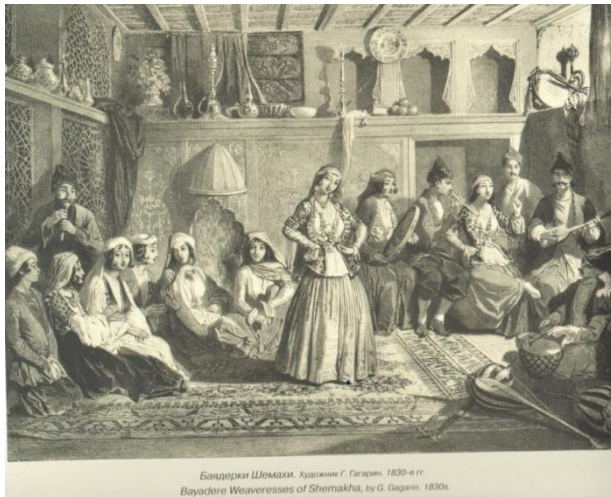
Ил.4. Г.Г. Гагарин. Баядерки Шемахи, 1830-е гг.

Более примечательна другая картина художника Г. Гагарина (ил. 4). В своей работе художник изобразил площадь, богатый интерьер в атмосфере веселья, создаваемого игрой музыкантов и танцовщицей. Изображенный на картине дом в роскошном убранстве, богатый ковер, настланный на пол, говорит о том, что дом принадлежит представителям аристократической среды. Ковер очень красив, его центральная часть выполнена в светлых оттенках и украшают его стилизованные растительные орнаменты, широкий бордюры тоже состоит из множества полос усыпанных мелкими мотивами. Ковры во все времена находили широкое применение в домашнем обиходе: ковер давали в приданое девушкам, его орнаменты позволяли судить о мастерстве и рукоделии невесты, ковры украшали места проведения свадеб, а также использовались на похоронах, ковры были показателем вкуса хозяев дома, степени их достатка.